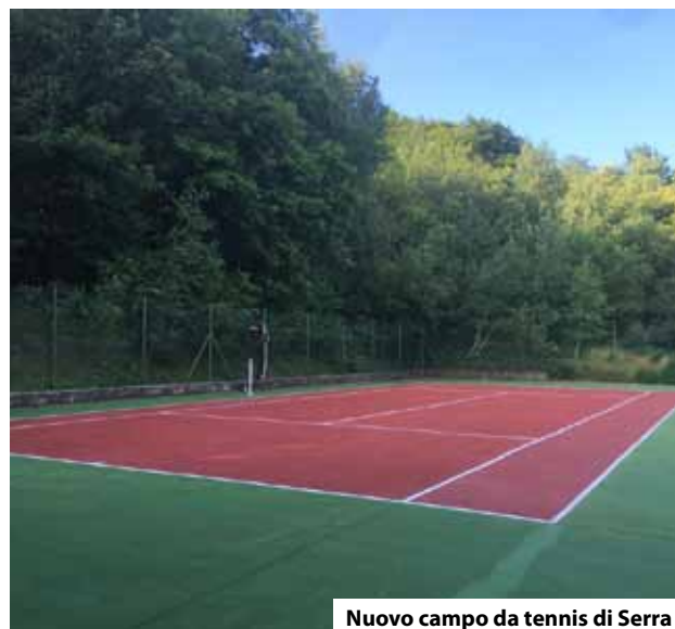
Nuovo campo da tennis di Serra

Il campo è disponibile a tutti, previa prenotazione anche telefonica, presso il Bar Rustico di Serra – tel. 0174 351170. Se necessario vengono fornite